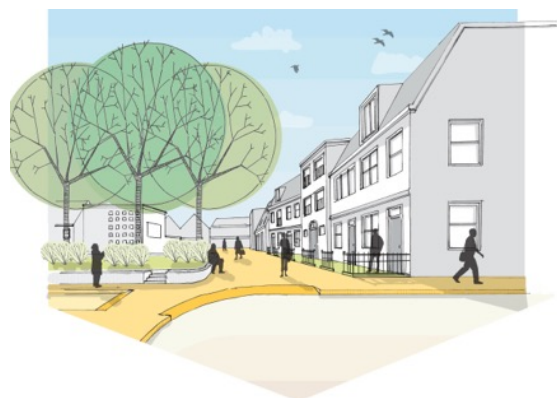
Woningen aan de Prinses Irenelaan en uitbreiding van het Oranjepark

Op het Amstelplein, tegenover het gemeentehuis, komt een aantal woningen met de mogelijkheid voor dienstverlening of detailhandel op de begane grond. Deze bebouwing heeft als doel het huidige plein beter vorm te geven waardoor er meer beschutting en een prettigere ruimte ontstaan.